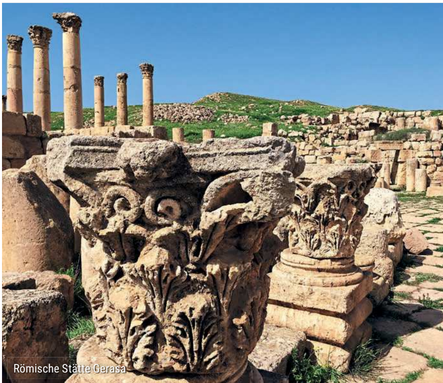
Römische Stätte Gerasa