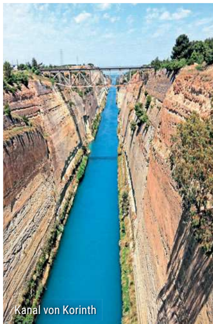
Kanal von Korinth