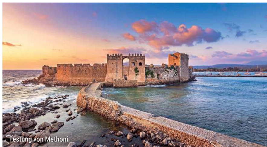
Festung von Methoni

Vorbei an Weinbergen und Olivenbäumen geht es Richtung Epidaurus. Angekommen besuchen Sie das Amphitheater, welches für seine aussergewöhnliche Akustik bekannt ist. Weiterfahrt nach Galatas, wo Sie mit einem Boot auf